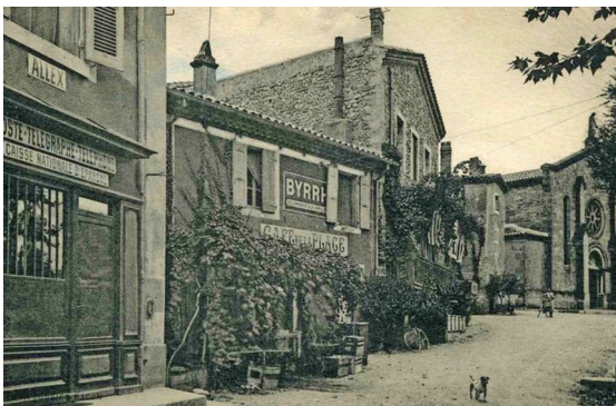
Bureau de poste, télégraphe et téléphone 1905

C'est en 1970 que fut créé le premier centre motorisé de la Drôme à Crest. Tout le service de distribution est centralisé à Crest, c'est de là qu'arrive et part le courrier du canton.